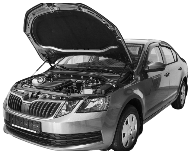
Skoda Octavia A7

Спасибо, что выбрали товар компании Russolift! Продукт обеспечивает плавный подъём и удержание капота.