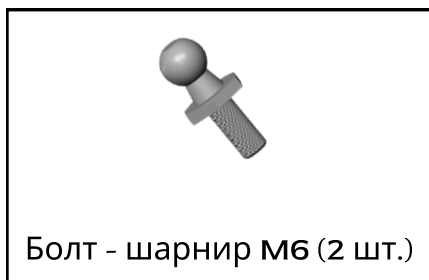
Болт - шарнир М6 (2 шт.)