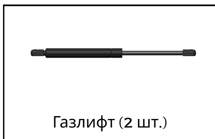
Газлифт (2 шт.)