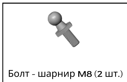
Болт - шарнир М8 (2 шт.)