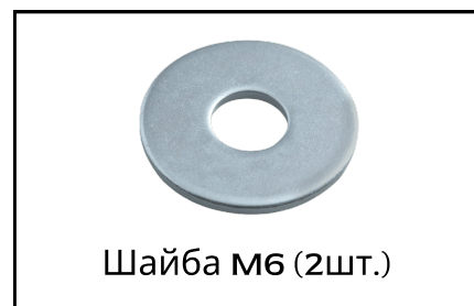
Шайба М6 (2шт.)