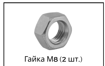
Гайка М8 (2 шт.)