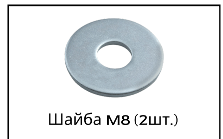
Шайба М8 (2шт.)