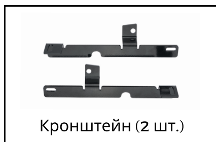
Кронштейн (2 шт.)