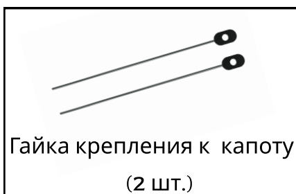
Гайка крепления к капоту (2 шт.)