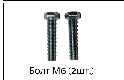
Болт М6 (2шт.)