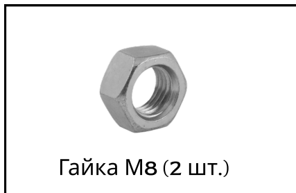
Гайка М8 (2 шт.)