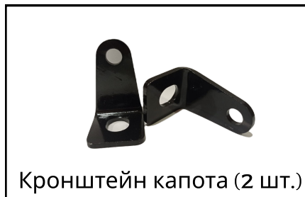
Кронштейн капота (2 шт.)