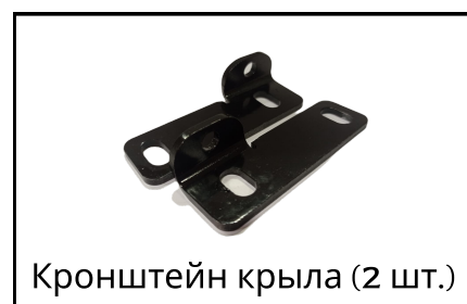
Кронштейн крыла (2 шт.)