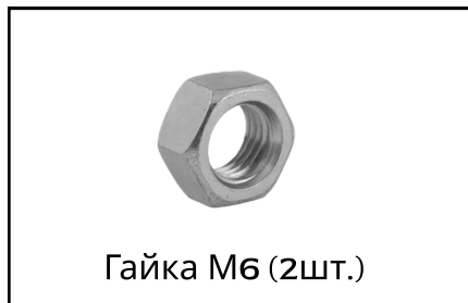
Гайка М6 (2шт.)