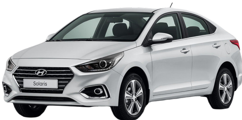
Hyundai Solaris 2

Спасибо, что выбрали товар компании Russolift! Продукт обеспечивает плавный подъём и удержание капота.