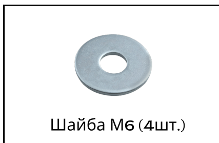
Шайба М6 (4шт.)