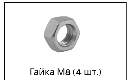
Гайка М8 (4 шт.)