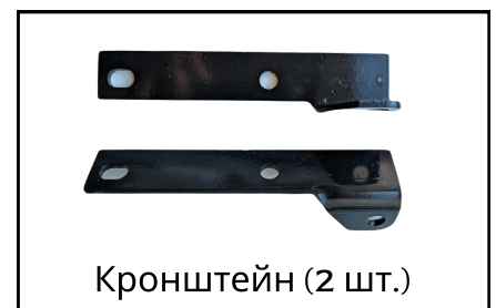
Кронштейн (2 шт.)