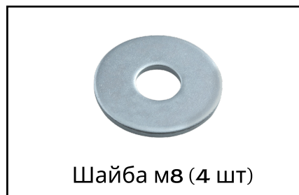
Шайба М8 (4 шт)