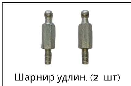
Шарнир удлин. (2 шт)