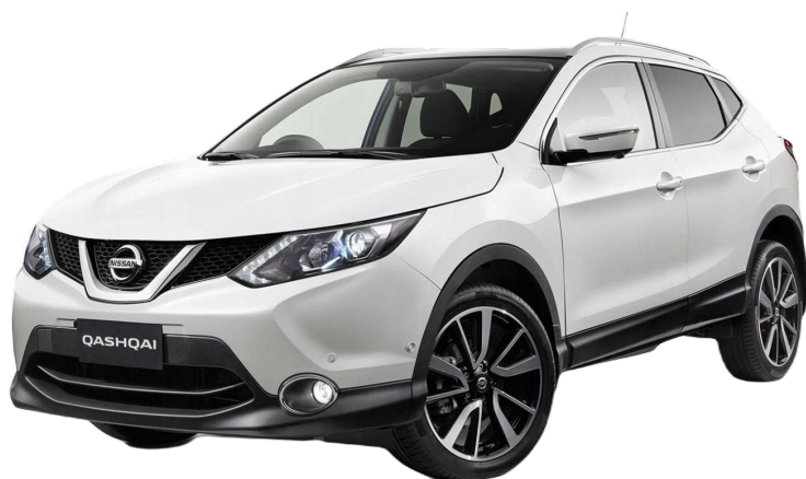
Nissan Qashqai J11

Спасибо, что выбрали товар компании Russolift! Продукт обеспечивает плавный подъём и удержание капота.